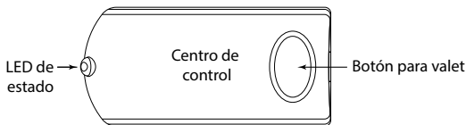
Sistema de antena del sistema dentro del vehículo

El Centro de Control envía y recibe comandos o mensajes hacia y desde el sistema. Se compone de: